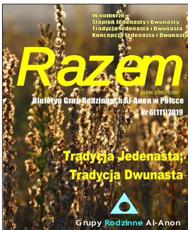
Biuletyn Grup Rodzinnych Al-Anon Nr 6 (111)2019

Kolejne wydania Biuletynu Grup Rodzinnych Al-Anon w Polsce „Razem ”